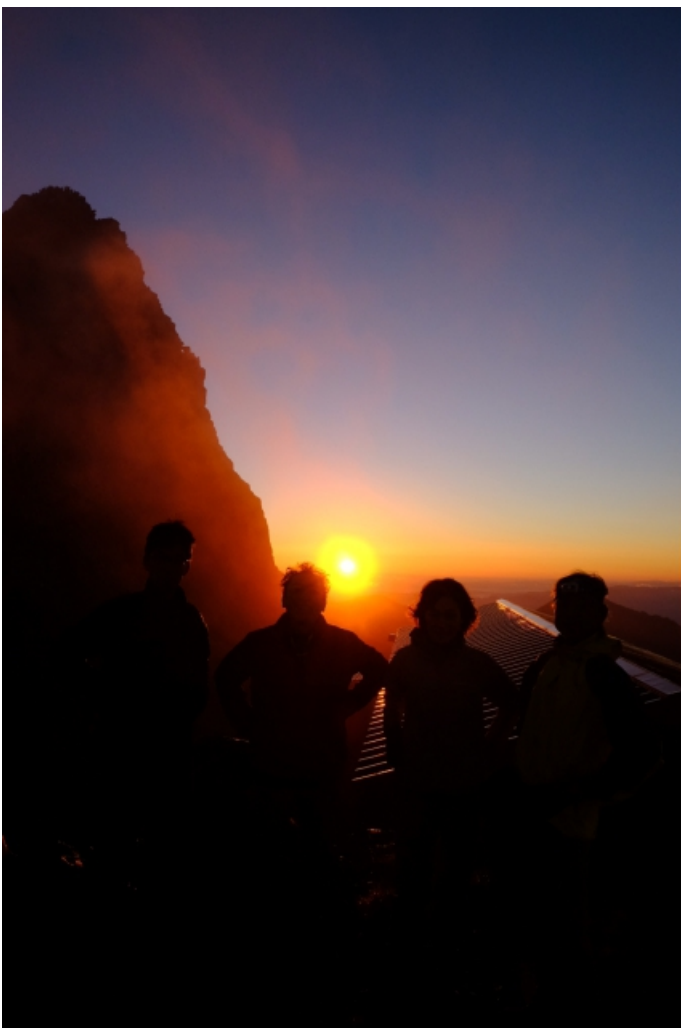
3 日目の朝 檜と朝日と記念撮影