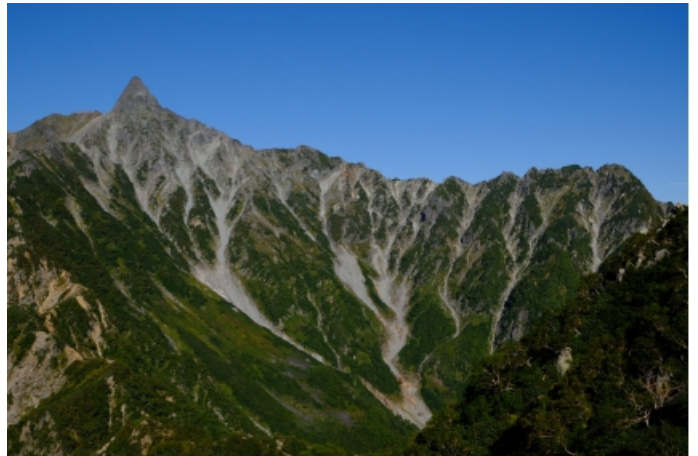
槍から右に北鎌尾根。行きたい！！