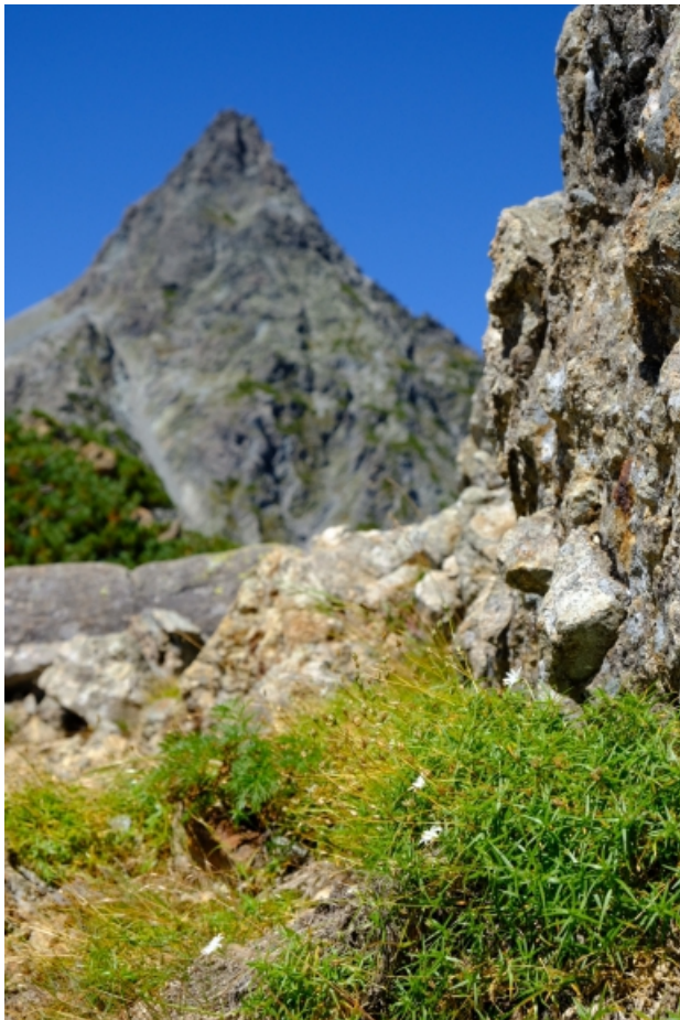
槍の穂先ががとんと近づいてくる