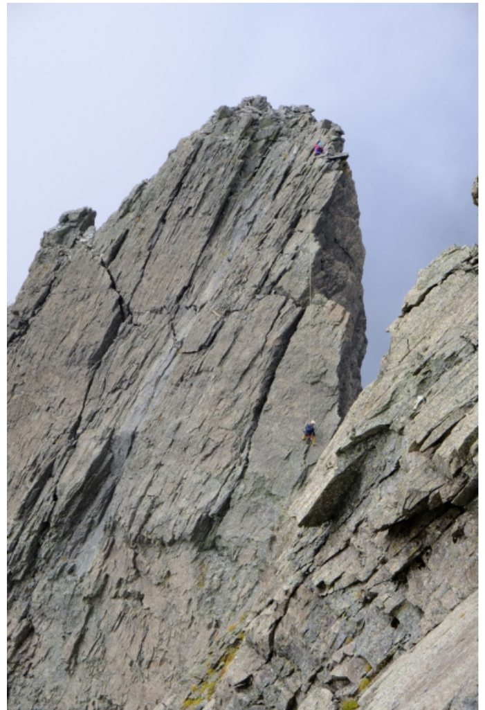
小檜から懸垂下降する人あり 小檜も行きたい！！