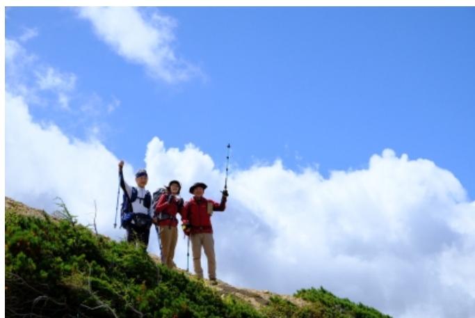
つらい登りも青空にテンションアップ