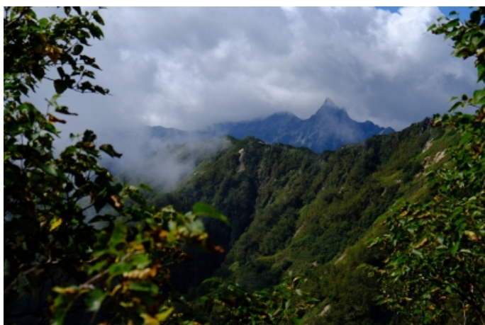
合戦尾根も終盤、目指す槍ヶ岳が見えてきた