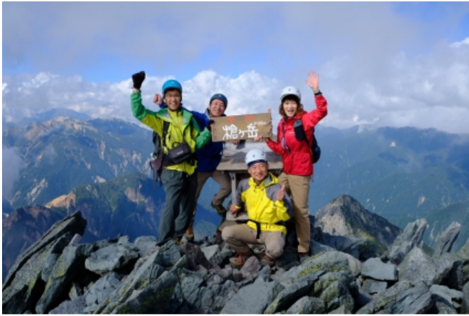
往復 2 時間 45 分かけて小屋から山頂へ 激混み