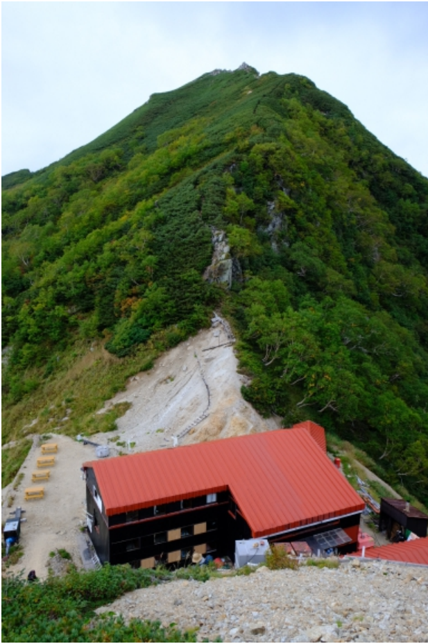
初日の宿は大天井ヒュッテ ここから槍は見えない