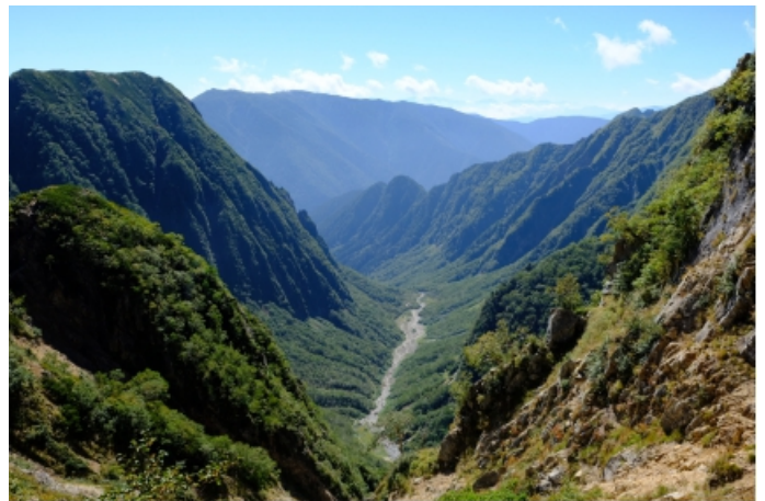
槍沢は分かりやすい氷河に削られたU字谷