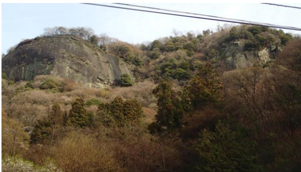
下から見た岩殿山

07:00 岩殿山公園駐車場～07:40 岩殿山畑倉登山口～8:20 岩殿山～8:55 三の丸跡展望台展望 ～9:30 兜岩～9:50 天神山～10:40 稚児落とし～花咲山方面分岐～12:25 岩殿山公園駐車場