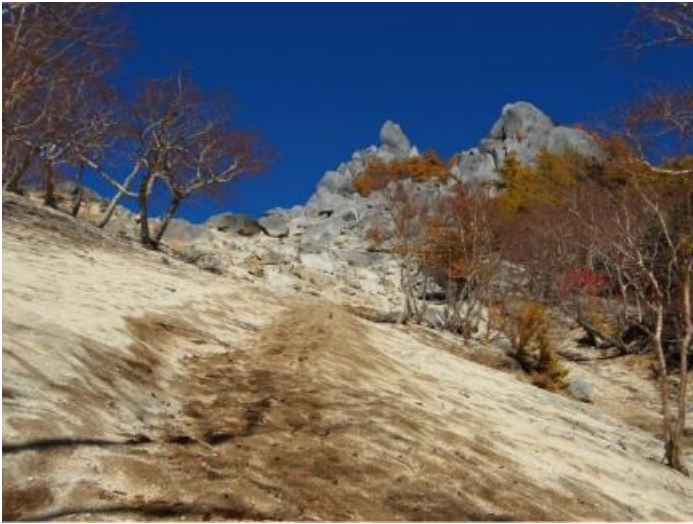
写真3 地藏岳へのつらい登り