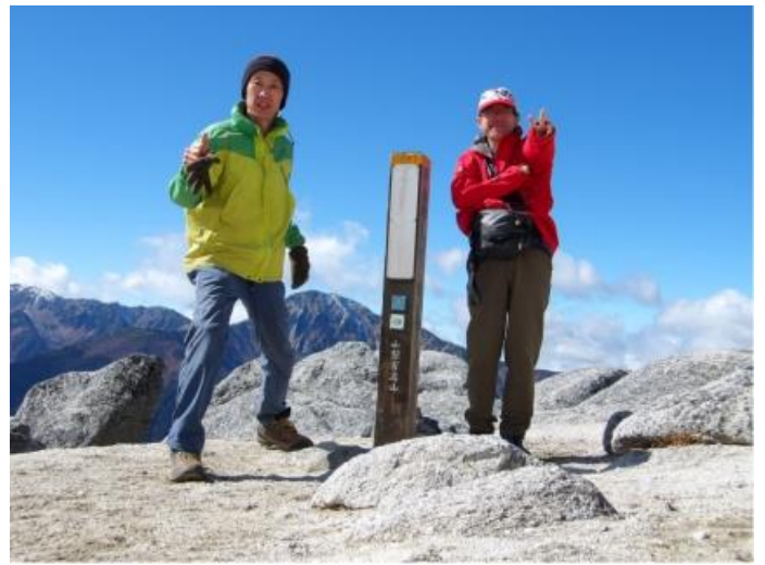
写真4 観音ヶ岳記念写真