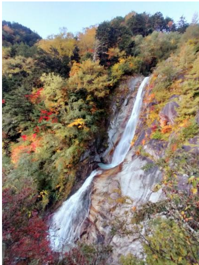
写真 1 南精進ヶ滝